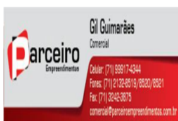
image001.jpg 13 KB