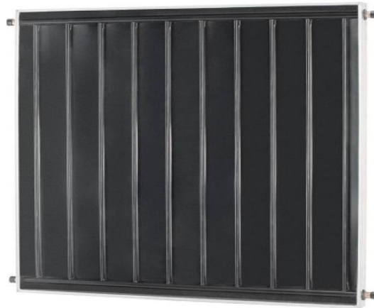
Figura 03 – Coletor com tubos em aço inoxidável.