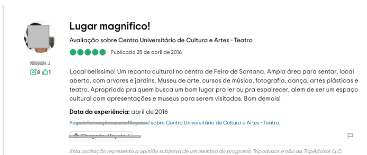
IMAGEM 2 – Avaliação de usuário do site Tripadvisor sobre o Cuca

Um dos comentários no recurso de avaliação disponível no Google chega a descrever o Cuca como um “Oásis” localizado no meio de uma cidade caótica. Outros comentários no site dão conta de aspectos que merecem citação aqui. Dentre esses aspectos se destacam as referências à beleza do espaço, à sua área verde e amplitude, à sua estrutura de forma geral, à sua importância para a região, à forma como se mantém continuamente ativo na promoção de eventos, à sua ligação com o passado representada pelo prédio histórico da antiga Escola Normal e também às suas iniciativas na área de formação artística e cultural. Mais avaliações espontâneas constam de forma similar no site Tripadvisor , como podemos ver no exemplo da Imagem 2. Oportunamente traremos mais alguns exemplos de avaliações da instituição feitas nesses sites, por considerá-las elementos relevantes para análise do fenômeno em foco.