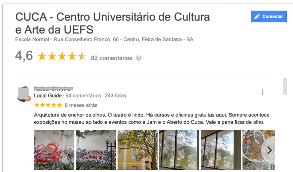
IMAGEM 1 – Avaliação de usuário do site Google sobre o Cuca

Situado em um privilegiado espaço no centro da cidade de Feira de Santana, podemos afirmar que a configuração do seu ambiente físico é um atrativo para a comunidade. Com efeito, a unidade é indicada como um dos pontos para visita, sendo considerada uma das principais atrações no município, tanto no site Tripadvisor como nas sugestões do Google do que fazer localmente. Nesse aspecto, para exemplificar a nossa afirmação vejamos na Imagem 1, um exemplo de avaliação sobre a instituição feita por usuários de forma espontânea no site Google .