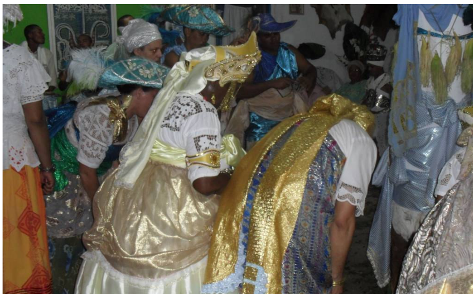
Figura 4 - Festa de Oxossi do terreiro ilê Axé Ogunjá.

No ano de 2010, o principal dia da festa de Oxossi do Terreiro Ilê Axé Ogunjá, do babalorixá Idelson coincidiu com realização do segundo turno da eleição presidencial, 31 de outubro de 2010.