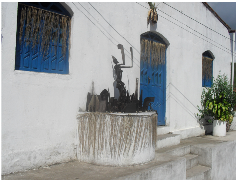
Figura 2 - Entrada do terreiro ilê Axé Ogunjá.