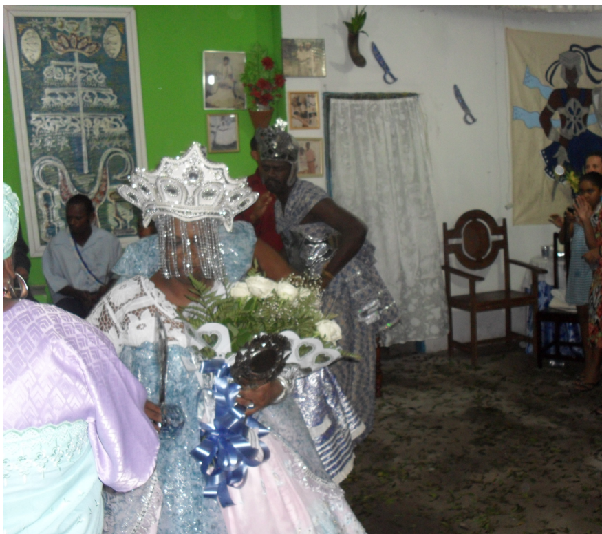
Figura 7 - Saída dos orixás para apresentar-se na festa de Ogum.

A festa prossegue com a apresentação individual dos orixás na mesma ordem do xirê. encontram-se incorporados em seus cavalos: Iemanjá, Ogum, Oxum, Oxossi, Ossain, Obaluaiê, Xango, Omolú, todos devidamente paramentados dançando e recebendo os louvores dos presentes. Enquanto a festa no barracão prosseguia foi servido o comes e bebe numa sala estendo-se para uma área de circulação entre o barracão e o assentamento dos orixás ao lado. O término da festa acontece depois que todos os orixás se apresentam. Vale lembrar que durante a apresentação orixás outros baixaram sobre seus cavalos, alguns foram suspensos outros preparados e trazidos para o salão para também se apresentarem, a exemplo de Iemanjá que se manifestou em D. Maria, a antiga dona do espaço do terreiro. Já passava das três horas da manhã quando chegou o término da festa, ogans e equédes passaram a se movimentar em função da limpeza e organização do espaço do terreiro para em seguida se recolherem.