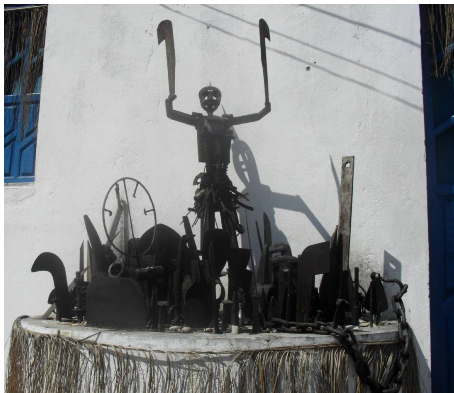
Figura 1 - Assentamento de Ogum terreiro Ilê Axé Ogunjá.

Ferramentas e outros objetos de ferro confeccionados pela técnica de fundição representam o orixá Ogum, constituindo-se num conjunto de 82 objetos, adquiridos no comércio local, preparados previamente por rituais específicos e assentados em nome do Orixá Ogum, em suporte de cimento e concreto erguido do lado de fora na entrada do barracão, em forma de meio círculo, com altura de 1,0m. Dentre os objetos assentados, destaca-se pelas dimensões e trato artístico, uma escultura em ferro fundido representando Ogum, adquirida na Feira de São Joaquim (Salvador). À sua volta encontra-se uma variedade de instrumentos e ferramentas utilizados em diversos ofícios, a exemplo entre outros: da carpintaria, da agricultura, da medicina e do artesanato.