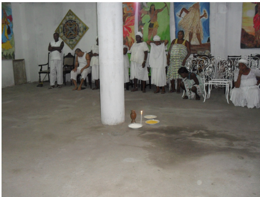
Figura 3 Despacho de Exu.