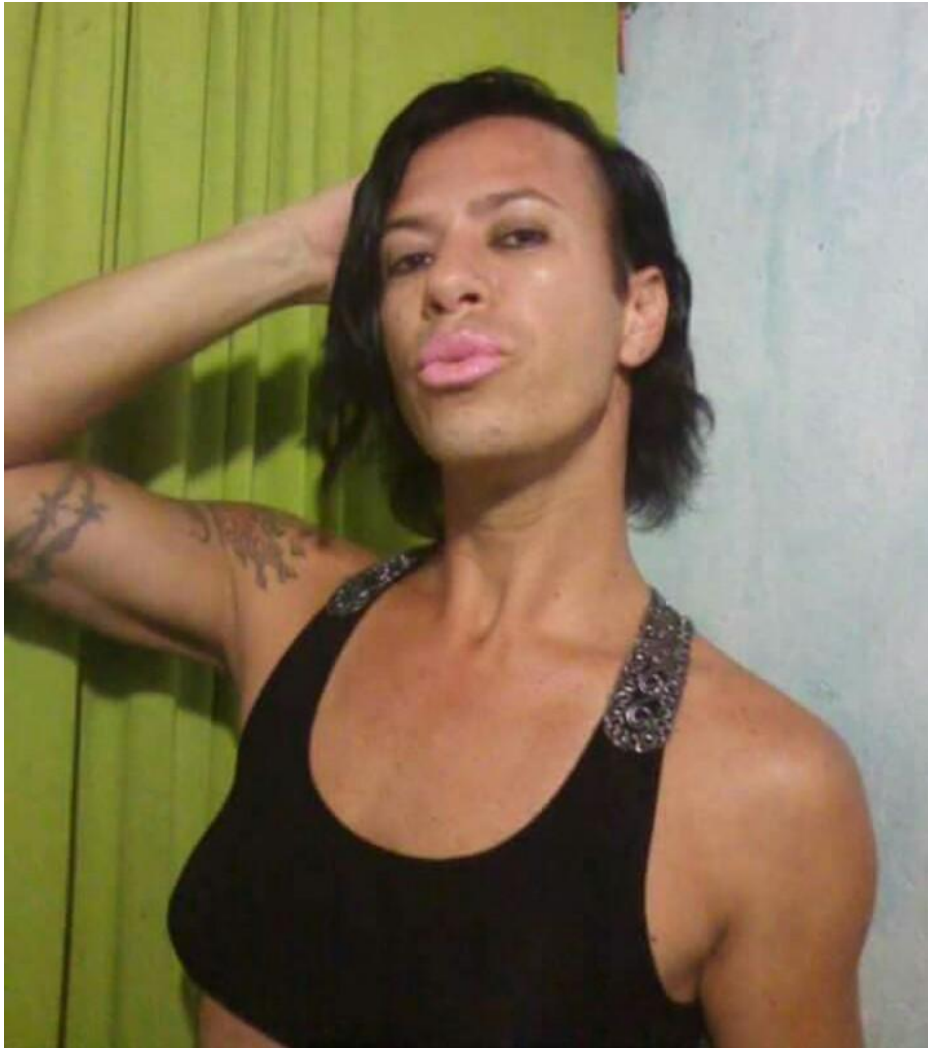
Figura 05