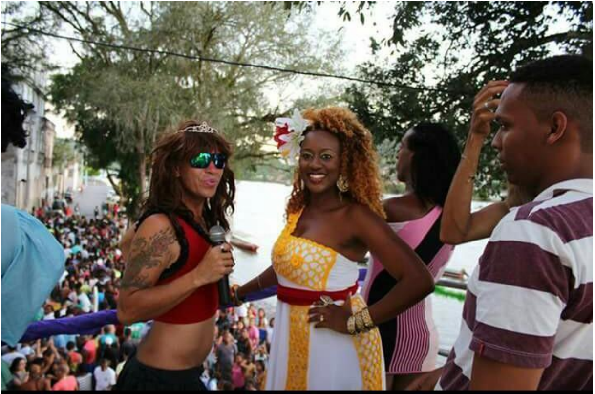
Figura 06