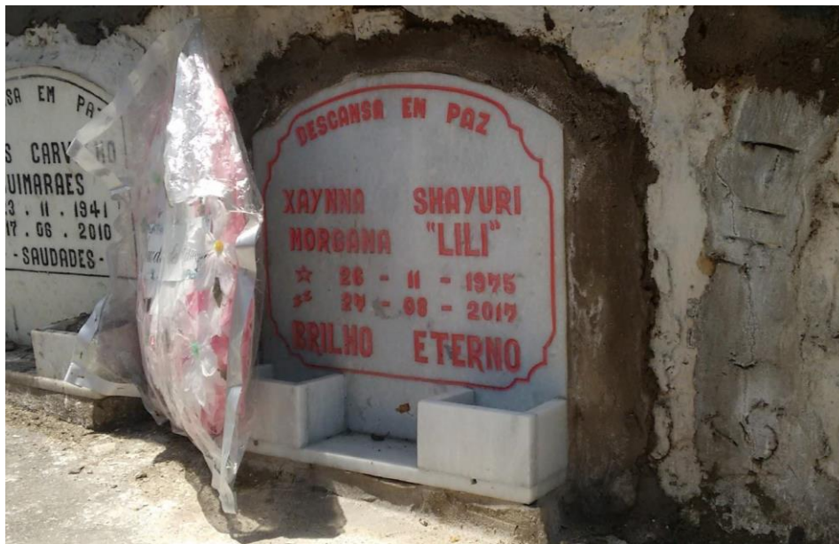
Figura 08 Enterro Arquivo Pessoal