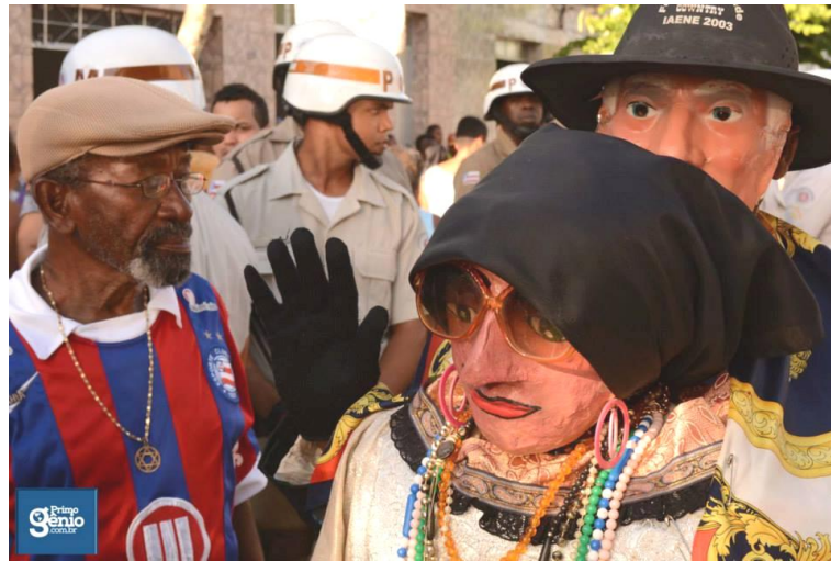
FIGURA 15. A Polícia e a festa.

Alguns estabelecimentos comerciais sevem para fazer uma ‘sondagem’ sobre a festa. Bem, no meu caso foi o salão STYLUS... muitos jovens falando da programação do palco e das lavagens... Neste processo de ouvir, duas questões me chamaram a atenção. Primeiro: o policiamento estava deixando a festa ‘lavagem’ sem graça, ou seja, com poucas brigas. Segundo: os que conseguem brigar, narram com ênfase, alegria ‘seus feitos’. Importante ressaltar que sempre batem mais do que apanham. Curioso isso! Quais possíveis questões estão em jogo? Masculinidade; territorialidade; luta de classe; racismo; revanche? É comum escutar que alguns entram na briga por terceiros, isto é, irmão, primo, amigo.