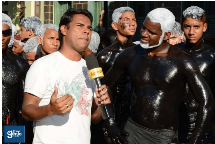
FIGURA 12. De frente com o cão.

uma representação rara nas festas populares do Recôncavo, tendo conhecimento apenas de existir também na Micareta em Jacobina (performance mais teatral e em menor quantidade, dialogando com almas, anjos e bruxas), no carnaval em Jiquiriçá (com cerca de trezentos integrantes e que saem mascarados) em Amargosa e aqui na Festa do Bonfim em Muritiba. Além do mais, é intrigante e não menos contraditório entender como o “cão” representante do diabólico pode estar participando na festa de um santo, que no nosso caso o Senhor do Bonfim é Jesus Cristo crucificado.