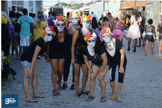
FIGURA 9. Terror e encanto nas ruas.

As muquiranas 20 por sua vez são compostas por meninos que “rebolam”, usam batom, bolsas, beijam, empinam a bunda, pegam na genitália de outros meninos, dançam etc., isto é, utilizam-se de estereótipos que caracterizam o “ser bicha” (ainda que seja uma construção social). Deste modo, as muquiranas provocam o debate (ainda que em tom de brincadeira) da questão de gênero.