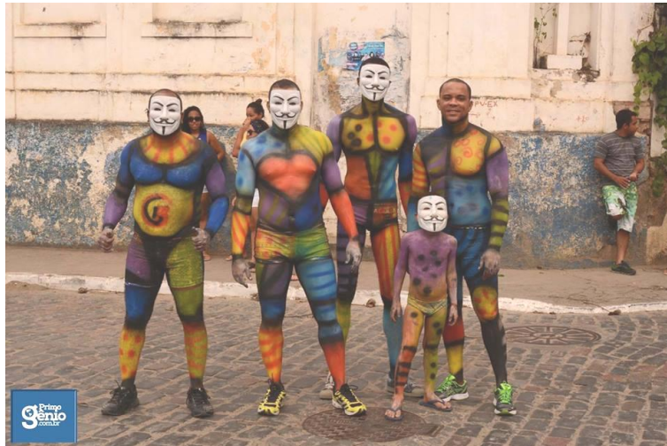
FIGURA 13. Cães de Elite homenageiam Romero Britto.

este grupo compõe a festa, todavia, opondo-se aos “cães” pretos e buscando inovações a cada ano. Cada vez mais percebo que o pesquisador que não é capaz de negociar no campo, acreditando ser o ‘iluminado pela razão’ em meio aos que ‘vivem nas trevas’, corre o risco de desenvolver uma pesquisa com maiores fragilidades em sua dimensão teórico-metodológica.