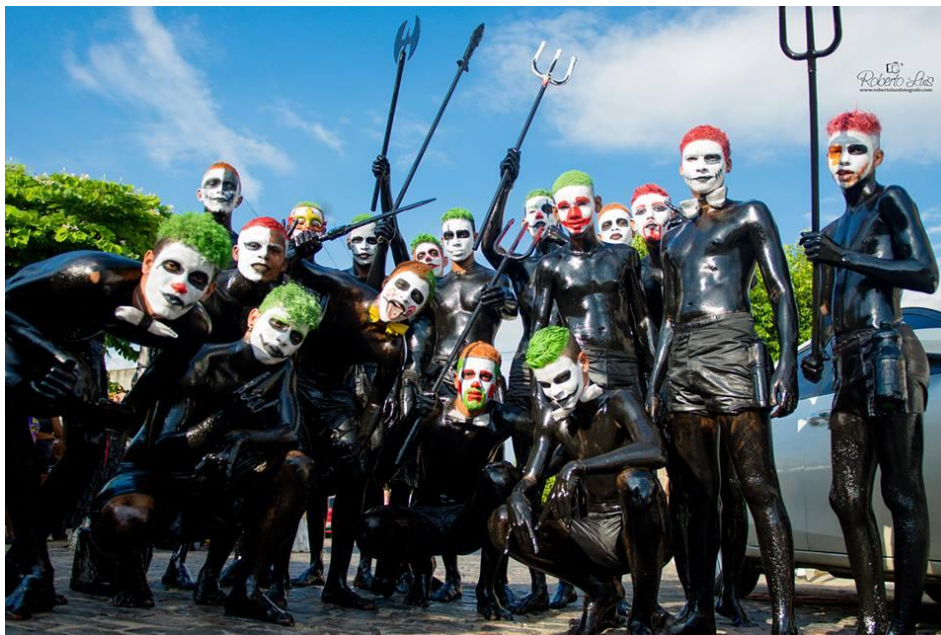
FIGURA 28. Diabruras do cão.

Com efeito, em campo, vi e ouvi os discursos-regras dos “cães” mais antigos para os mais novos dizendo: “Não sobe no passeio; não brinca com quem você não conhece; não mele as casas e carros”. No entanto, vi e sofri um toque do “cão” (perdi minha camisa), uma espécie de “me bati sem querer”, assim sendo, havia no semblante dele, um riso “bakhtiniano” e um pedido de desculpa. Ora, este simples exemplo aponta para estratégias diversas de ações destes agentes na festa. Semelhantemente, muitas das orientações dadas pelos mais antigos, são parcialmente obedecidas, pois, no dia seguinte de “sair de cão”, é corriqueiro escutar inúmeras queixas sobre os mesmos temas, isto é, cumprimento das regras. Saliento ainda que devido aos vários grupos que saem de “cão” na festa, tornam-se inevitáveis vídeos nas redes sociais de alguns desses agentes brigando nas lavagens.