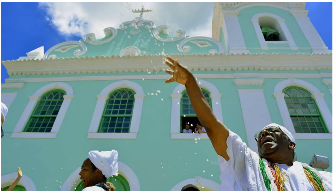
FIGURA 5. Lavagem das baianas. Arquivo Prefeitura Municipal de Muritiba.

A maioria absoluta dos freqüentadores das festas de largo só quer divertir-se, mas uma grande parte deles ‘dá valor’ ao que se faz na igreja, ainda que esse ‘dar valor’ se limite a uma vaga atribuição de importância, a um simples testemunho de aceitação da realidade do sagrado (um breve ato de fé, com uma declaração de respeito distante, em reconhecimento da eficácia do santo e da riqueza de uma tradição). Por outro lado, muitos dos que vão à igreja não participam da folia do largo. Porém há os que se fazem presentes nos dois espaços da festa (SERRA, 2009, p.73).