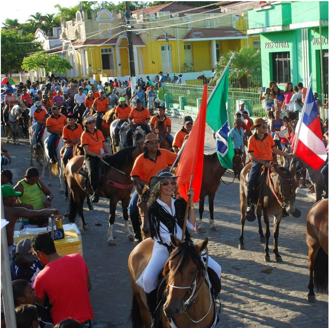
FIGURA 4. Pregão anunciador 2.