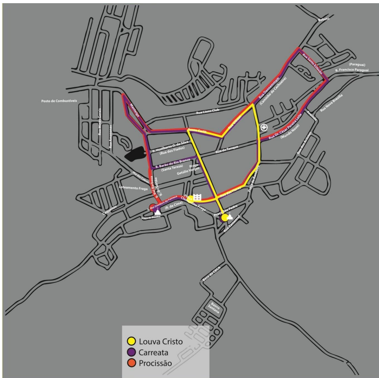
FIGURA 7. Roteiro de mais três manifestações religiosas (haja vista que a Lavagem das Baianas, manifestação religiosa e central na Festa já está apresentada no mapa anterior) dentro dos dias da Festa do Bonfim de Muritiba. Mapas desenhados por Fagner Fernandes (Graduando em Artes Visuais pela UFRB).