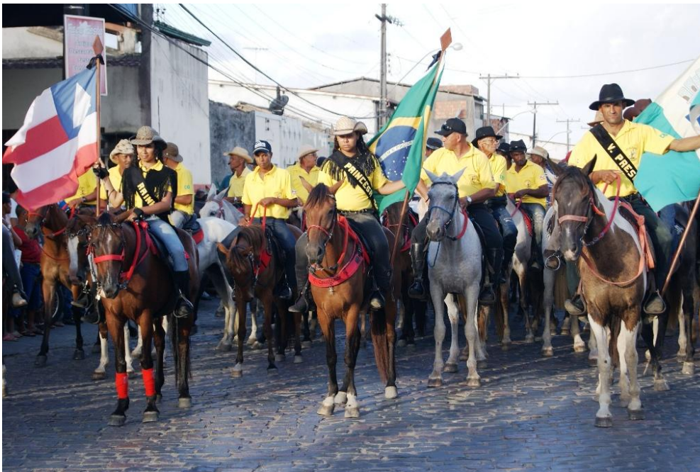
FIGURA 3. Pregão anunciador 1.