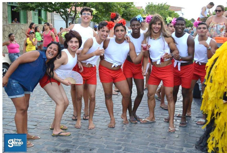
FIGURA 16. Lá vem a lavagem.