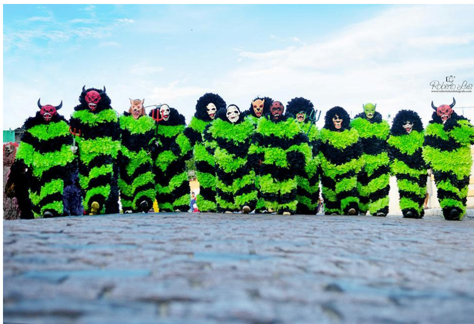
FIGURA 21. Padrão diferenciado.