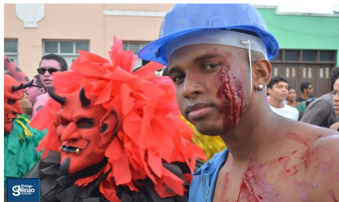
FIGURA 6. Brincando com a violência.

Nas ruas, percebo ainda transformações nas caretas. O que são elas? Por caretas pode-se ressaltar que elas saem em grupos de amigos e parentes, geralmente são adolescentes e jovens (meninos e meninas) de posições econômicas distintas que se encontram nas lavagens com intuito de celebração, brincadeira, resolver rixas, uma vez que “ a máscara, na festa, não é usada para esconder, para encobrir, para enganar, mas, para que o indivíduo seja ele mesmo e por si mesmo, liberto dos constrangimentos sociais” (PEREZ, 2012, p.36-37). Contudo, percebe-se um esconder-revelar, um exercer-sofrer tensões nas ruas da cidade. Há uma ênfase estética e performática assumida por alguns foliões, isto é, não basta participar da lavagem, é preciso ter estilo.