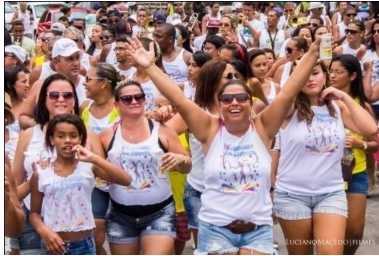
FIGURA 11. Lavagem da Hidro.

Desta maneira, ficou perceptível que em muitas paredes, vidros de carro, outdoor e redes sociais a II Lavagem da JR Atacado e Varejo que ocorreria no dia 08-02-15 foi divulgada com muito destaque. Lembro-me do carro de som com um homem em cima (fazendo suas performances e brincando com comerciantes e pedestres), convocando toda a ‘cidade’ para a lavagem. Enquanto o rapaz dançava dizia: ‘II Lavagem do JR Atacado e Varejo vai ser massa! Este ano com a participação dos filhos de Gandhi, cento e cinquenta músicos tocando, treze mil cervejas de latão grátis, cordas e segurança dos policiais’. O locutor ‘show-man’ ainda sinalizava: Você compra cinquenta reais em compras e ganha a camisa da lavagem e fichas para pegar a cerveja.