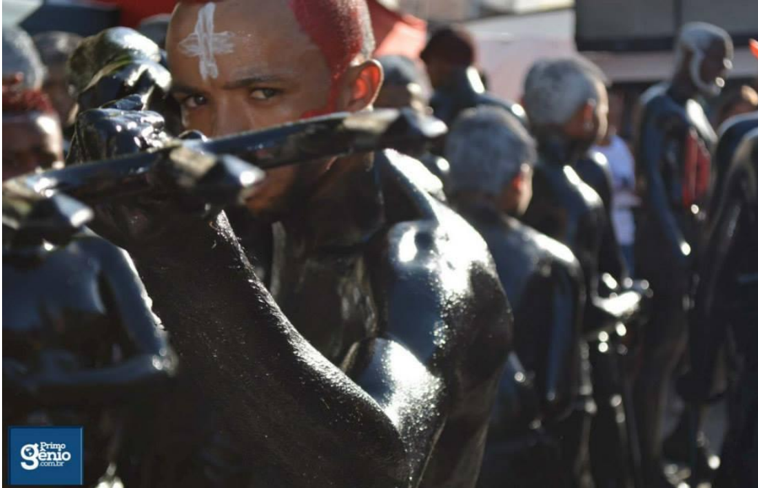
FIGURA 1 1 . O TRIDENTE DO “CÃO”.

O caminho descrito neste início de conversa consiste em relatar um processo de fuga. Estava à procura de um novo problema a ser investigado, não isolado da Festa do Senhor do Bonfim, mas inserido no centro dela, não isento, imparcial, mas subjetivo e transitório, voltado para o consumo e, em especial, para a mercantilização das lavagens. Parti então atrás do trio deixando o “cão” no passado 2 . Acreditava que podia fugir dele como o diabo foge da cruz e achei que atrás do trio só não vai quem já morreu! Ledo engano, pois o trio desapareceu parcialmente da festa e me senti como que desterritorializado em minhas próprias convicções. Parei na rua e tão logo recebi três espetadas nas costas. Era o “cão” com seu tridente, que carregava em cada lança a tríade motivacional do meu estudo. Fé, folia e consumo estavam encarnados naquele corpo preto, pintado de óleo queimado. Tão logo percebi que o diabo não foge da cruz, mas esconde-se, por vezes, atrás dela. Decerto segui minha trajetória com o “cão”, seu chocalho e agora com seu tridente. Ora, através do estudo sobre “o cão” (um dos integrantes das