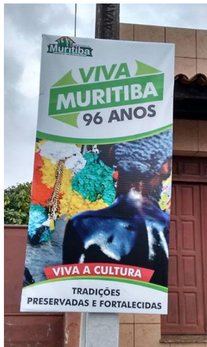
FIGURA 18. Símbolos em Disputa. 2015.

Percorrendo as ruas da cidade na semana que antecedia o seu aniversário, comecei a vislumbrar, com um olhar misto de pesquisador-morador, os cartazes que foram pendurados em alguns locais do município. Existiam propagandas da saúde, da educação, da realização de obras, da limpeza, do esporte e de outras tantas áreas que se encontram sob a responsabilidade do órgão público municipal. Mas um desses cartazes me causou um sentimento de familiaridade e tão logo estranhei. O “cão” preto apareceu! Ele estava de costas, embora como representante simbólico de preservação e fortalecimento da tradição cultural local. Com efeito, muitas tensões estavam ali, depositadas naquela fonte iconográfica, anunciando que os símbolos estão em disputas e o “cão” preto, que por muito tempo foi ocultado nas paredes pintadas e nos outdoors e cujo contraponto com o Bonfim o fazia símbolo de negação por parte de muitos religiosos, agora, na luta por um espaço de afirmação identitária, vem assumindo a simbologia de expressão cultural de um grupo social!