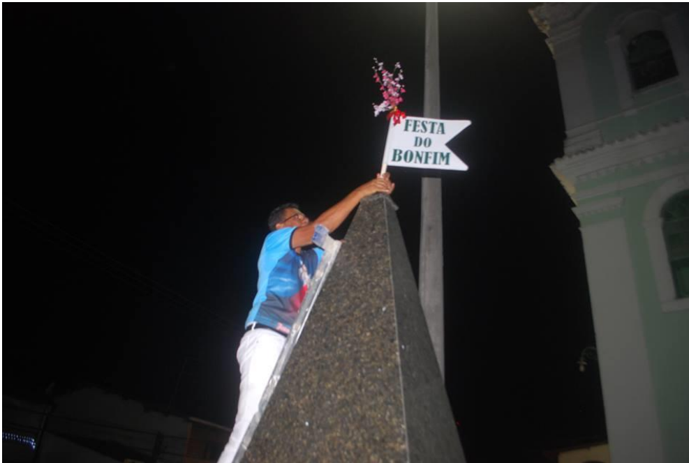
FIGURA 2. Fincamento da Bandeira.

que é o bando anunciador da festa. Tem a lavagem. Tem a festa aqueles dias todos e tem a procissão que é o encerramento...é nessa Bandeira do dia primeiro de janeiro [vai na frente do cortejo]...tem as duas filarmônicas...tem duas comissões [a religiosa e a da festa na rua], a Bandeira ao som de muitos fogos é fincada no mastro para que as pessoas tomem conhecimento dos dias que vão acontecer as atividades... essa é a finalidade da Bandeira: chamar a comunidade para a rua e praça (Fala de uma guardiã da cultura popular).