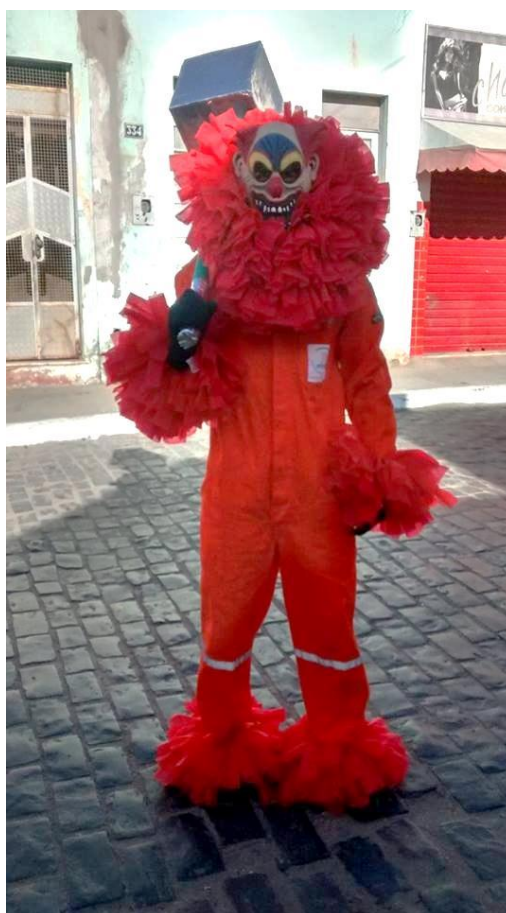
FIGURA 25. Operário do medo.