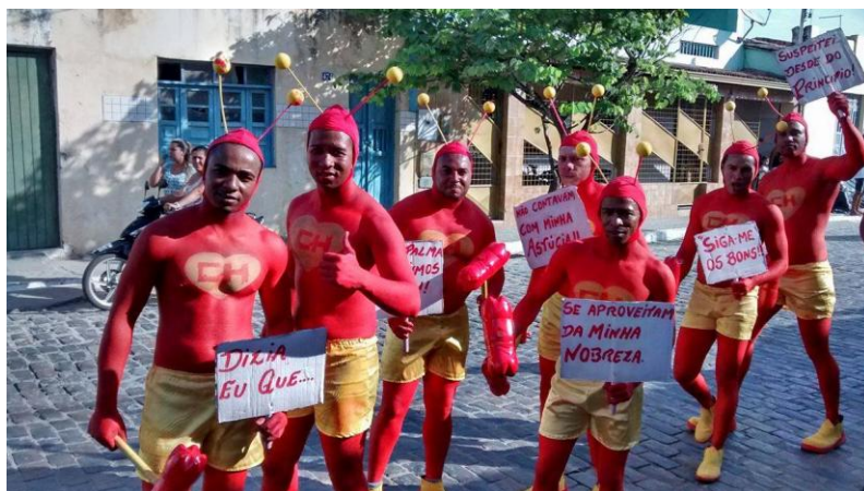
FIGURA 26. Os Chaplins.