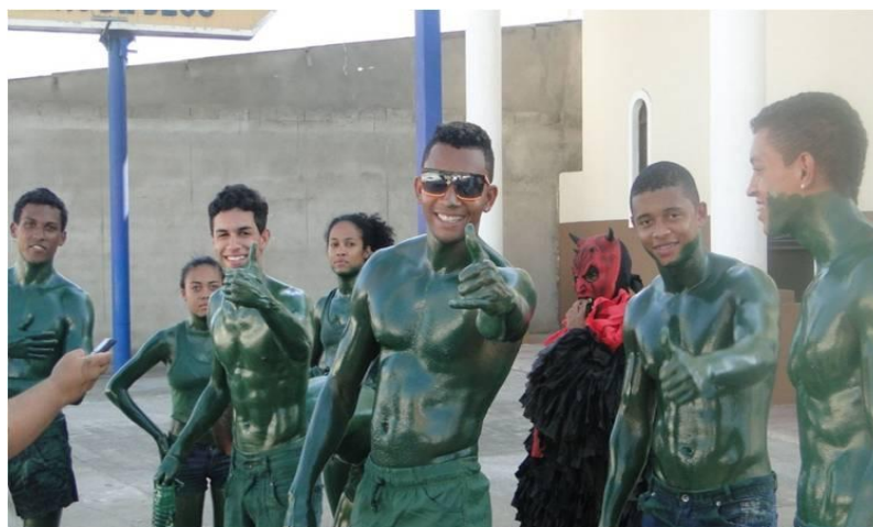
FIGURA 23. Hulk ou cão?