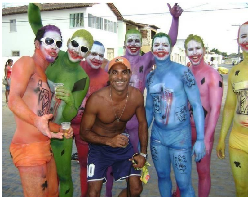
FIGURA 24. Os Cães de Elite. Arquivo Prefeitura Municipal de Muritiba