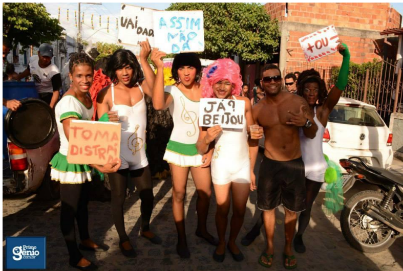
FIGURA 10. Elas são eles.

Entrevistando um rapaz que já sai de muquirana há mais de vinte anos fui surpreendido com uma questão bem interessante: Ao mencionar o olhar dos outros sobre ele, muitas vezes ouve na rua a expressão: - Tá aproveitando o momento, heim? Refleti então e mais uma vez percebi como as performances vão criando novas formas e outros personagens que descaracterizam a ideia de uniformidade nas relações sociais. Além do mais, ao ser indagado se era melhor sair de muquirana ou de 'cão' o interlocutor afirmou: