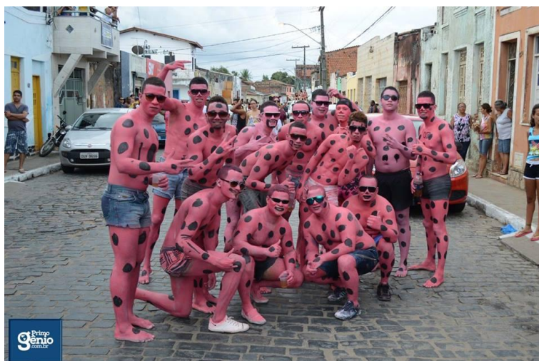
FIGURA 22. Os panteras! Arquivo Primogênito Notícias