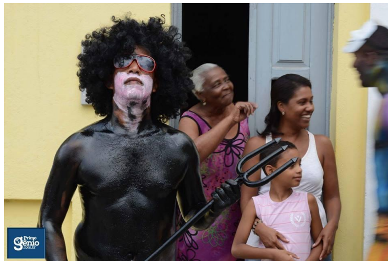
FIGURA 17. Vem cá cão!

Há muitos fatores que sustentam os discursos evangélicos contra a festa do Bonfim em Muritiba. Sinalizo aqui dois: a herança anti-católica e pouco dialógica no protestantismo e processos de controle e castrações do corpo-prazer. Todavia, mesmo diante de narrativas contrárias à Festa do Bonfim por parte dos evangélicos na cidade, é bastante corriqueiro encontrá-los (não só eles) nas janelas, portas e varandas de suas casas. Desta forma, abordo através de uma ousada brincadeira como as lavagens invocam uma identidade muritibana que está para além dos valores religiosos seguidos.