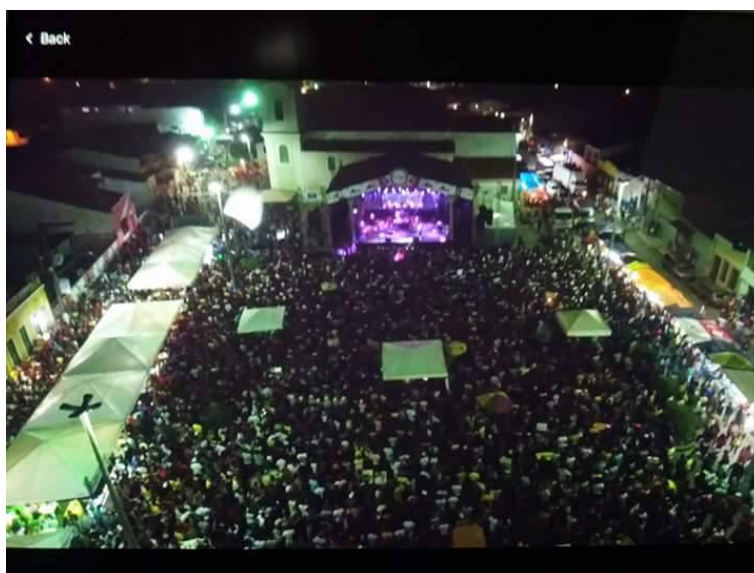
FIGURA 19: Fé, folia e consumo. 2016

Não restam dúvidas de que essas expressões culturais presentes nos festejos devem ser compreendidas para além de um prisma dicotômico, logo, elas estão em movimento, em fluxo. Daí, tais práticas são “tradicionais” e “modernas” ao mesmo tempo, pois, se por tradição e manifestação popular entende-se os foliões participando das lavagens pelas ruas da cidade abertamente (sem cordas e abadás), vem ocorrendo por sua vez uma ampliação das lavagens padronizadas com cordas e abadás além de uma ênfase (investimento) nas atrações do palco na praça.