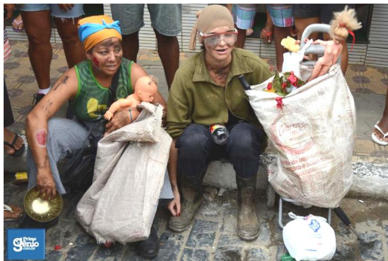
FIGURA 14. Rindo da miséria.

De fato, esse enfrentamento do "cão" na rua é também apresentado por outros agentes das lavagens, os quais, com fantasias criativas, criticando muitas vezes questões sociais, utilizam-se do riso como um elemento social-coletivo que ultrapassa a dimensão individual-subjetiva. Na verdade, comungo da concepção de Bakhtin (2010) que, ao perceber o riso em um contexto festivo carnavalesco popular, vislumbrou uma característica emancipatória, visto que o ato de rir sempre permaneceu como uma arma de liberação nas mãos das camadas populares.