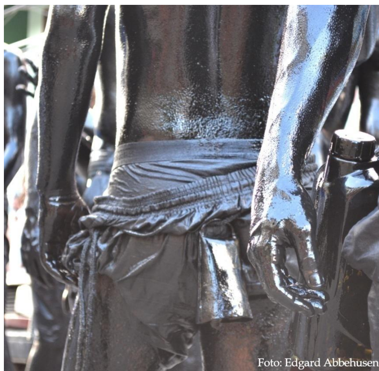
FIGURA 27. O chocalho anuncia.

Outrossim, o grupo dos “cães”, sofreram metamorfoses para permanecer, uma vez que, seu teor “diabólico popular” foi diminuído através de uma ênfase em mais uma prática lúdica no circuito da festa. O “cão” foi adestrado-civilizado. Isso não significa que, vez por outra, nos seus modos de agir, de reencenar e rememorar despertando e construindo emoções, no processo de liberdade-controlada, a liberação da dimensão “selvagem-animalesca”, não se sobreponha causando conflitos pelas ruas da cidade.