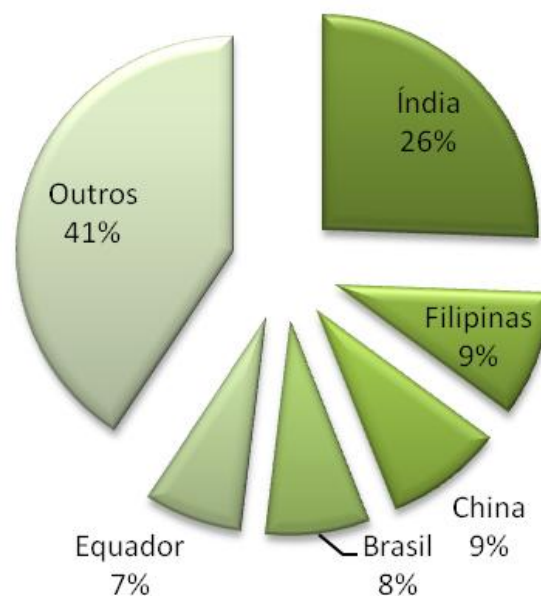
Figura 1. Produção de banana no ano de 2008 pelos principais países produtores.