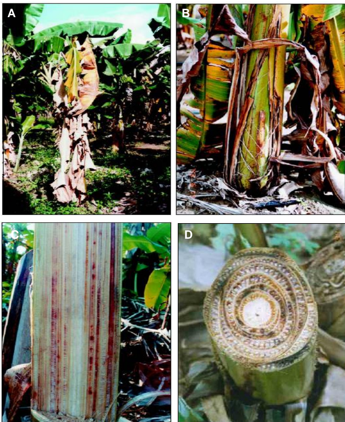
Figura 4. Sintomas do mal-do-Panamá em plantas de bananeira. (A) Murcha e amarelecimento foliar em planta com mal-do-Panamá. (B) Rachadura do Pseudocaule de planta com mal-do-Panamá. (C) Corte horizontal mostra a linha de vasos infectados que começam e segue em direção ao ápice da bainha. (D) Presença do patógeno verificada pela descoloração pardo-avermelhada na área periférica, centro sem sintomas. (CORDEIRO et al.,2004)