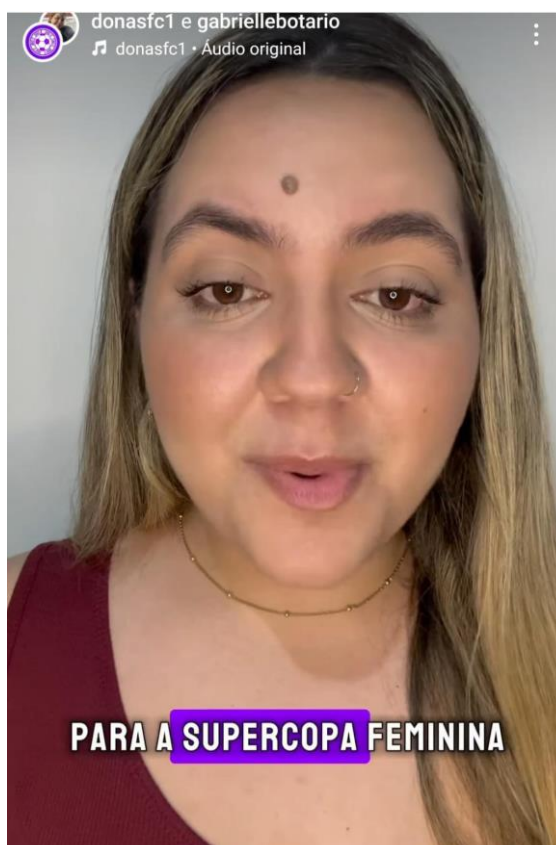
Figura 25: boletim informativo DonasFC