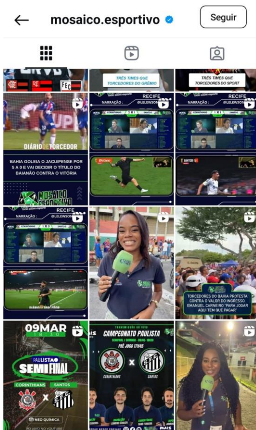
Figura 28: página instagram/Mosaico Baiano