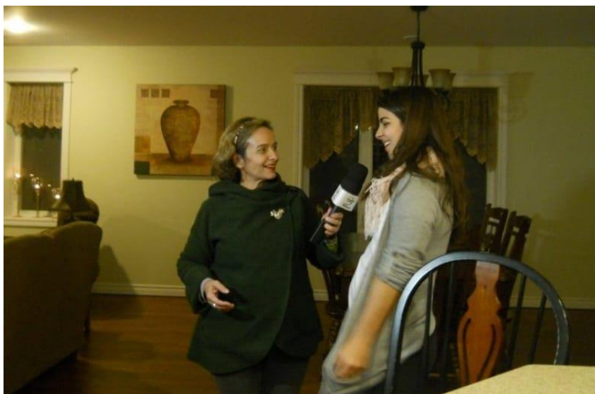
Figura 11 : Site Portal Turismo Total

interditados às vozes femininas, ela abriu caminhos para as gerações seguintes, que passaram a encontrar, ainda que timidamente, algumas referências femininas no microfone das transmissões esportivas.