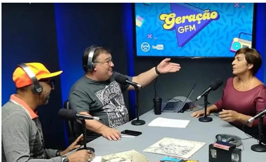
Figura 6 - Estúdio do Vídeocast GFM 90.1