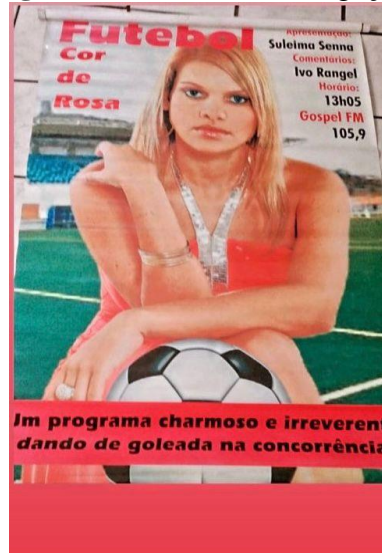
Figura 13: Cartaz de divulgação

emissora, a continuidade do projeto tornou-se inviável, pois, além da ausência de remuneração para a equipe, os custos com deslocamentos para os estádios e coberturas de coletivas não podiam ser sustentados sem financiamento.