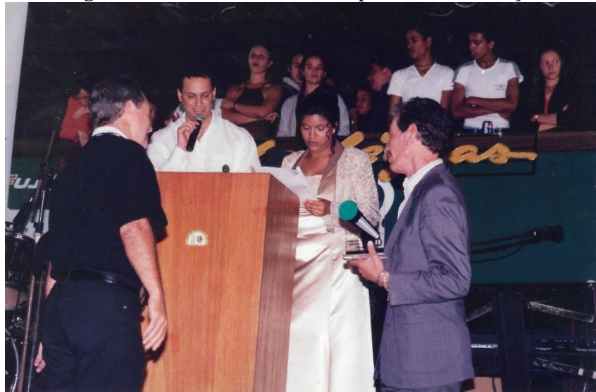
Figura 8 : Evento teste antes da primeira contratação

consistia em apresentar um evento voltado para o agronegócio ao lado de um locutor experiente da emissora se eu tivesse um bom desempenho naquele evento seria contratada, visto que a locutora na época conhecida como Jô Brasil havia recebido um convite para trabalhar em uma emissora de São Paulo.