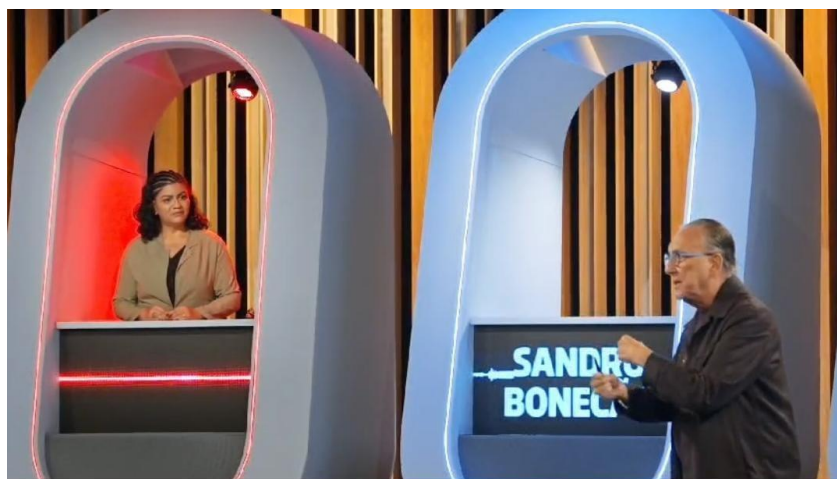
Figura 20: Manu Pilger e Galvão Bueno