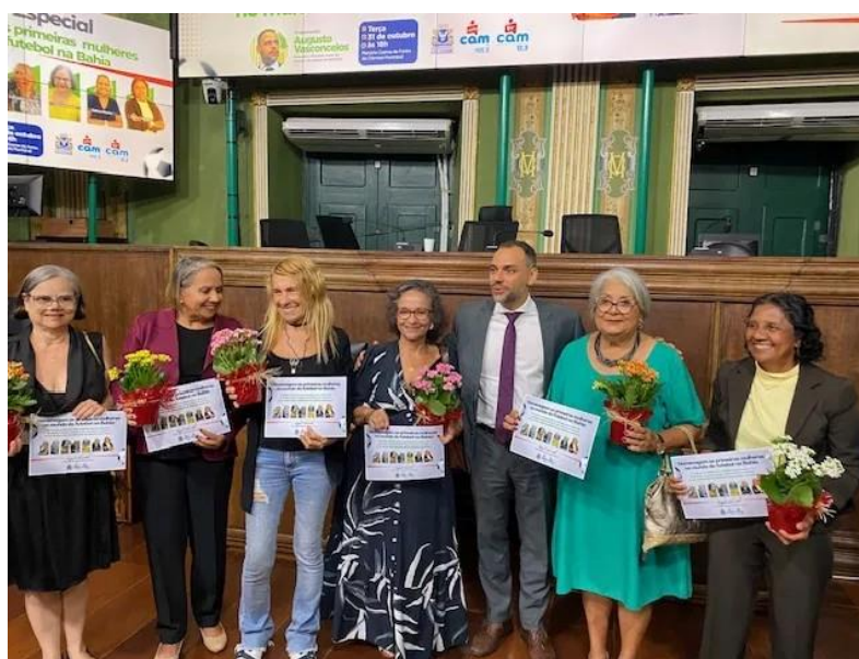
Figura 12 – Solenidade na Câmara de Vereadores de Salvador

Reconhecê-las com uma simples homenagem é apenas o primeiro passo — o mínimo que pode ser feito diante da relevância histórica que carregam. Por isso, impõe-se a urgência de ações mais amplas, sistemáticas e contínuas de valorização, documentação e preservação da memória dessas profissionais, de modo a garantir não apenas sua inserção efetiva na historiografia do futebol e da comunicação na Bahia, mas também a inspiração de futuras gerações de mulheres que desejam narrar, comentar e viver o esporte com voz ativa.