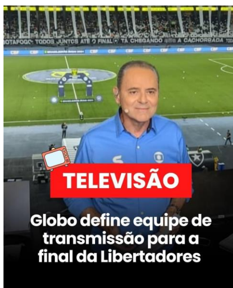
Figura 22: Equipe de transmissão para a final da Libertadores